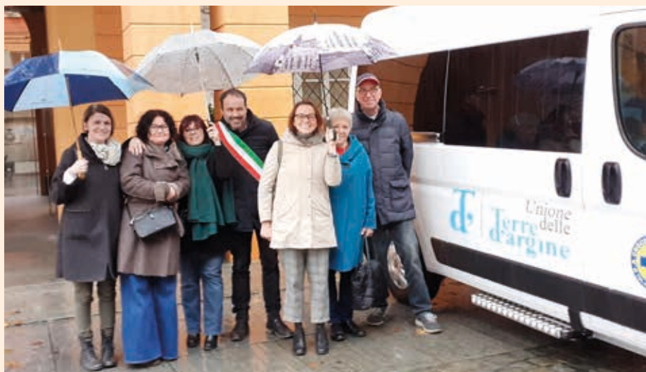
L'Unione Terre d'Argine ha donato alla Croce Blu un pulmino per i trasporti sociali.